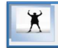
( -ว่าง- ) ครูผู้ดูแลเด็ก