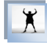
( -ว่าง- ) นักวิชาการศึกษา(ปก./ขก.) โทร.๐๘๙-๗๑๓๙๕๙๑